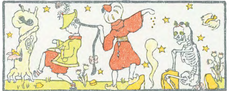
Aladdin en de toverlamp © Luk Duflou

De tentoonstelling Uit het goede hout toont de boeken RinkRank , Sneeuwitje en Aladdin en de toverlamp , gedocumenteerd met tekeningen en voorwerpen. Er is ook een filmpje te zien over de geest van Aladdin en over de techniek die Luk Duflou gebruikt voor zijn kleurenhoutsnedes.