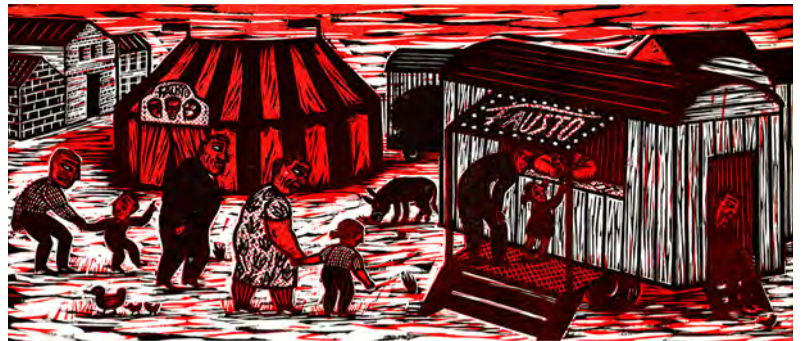
Het circus van Dottore Fausto © Isabelle Vandenabeele

De gedurfde, aparte sfeer die Isabelle creëert blijft niet onopgemerkt. De talrijke bekroningen prijzen haar werk als een verrijking voor de jeugd- en volwassenenliteratuur.