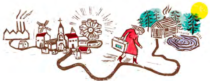
Wolinoti. Het Houten Kind © Vanessa Verstappen

Inspiratie vindt Vanessa overal waar ze rondkijkt en dagdroomt. Curieuze miniatuurbeeldjes of rubberen diertjes op een rommelmarkt? Ze kunnen de blauwdruk zijn voor de karakters in een nieuw boek. Voorts houdt ze van uitslapen, haar kronkelende kamerplanten, (jeugd)theater, wekelijks kringwinkelen, verse tomatensoep en haar babbelzieke kat.